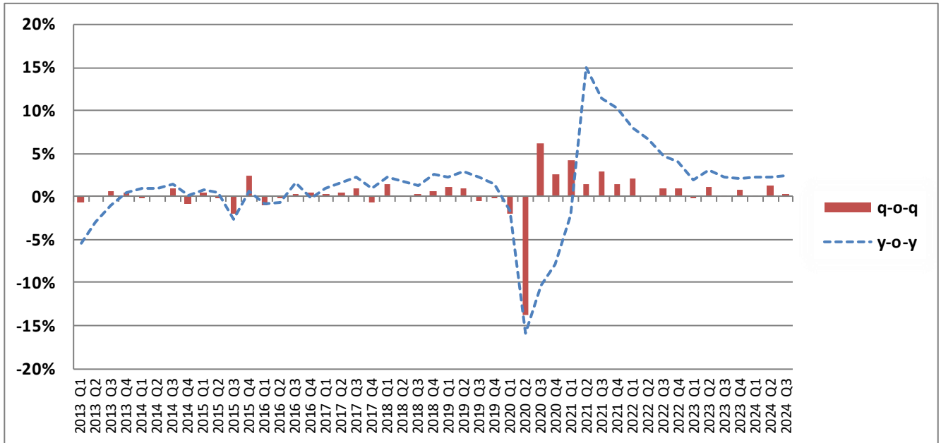
Διάγραμμα 2: Ακαθάριστο Εγχώριο Προϊόν (ΑΕΠ) σε όρους όγκου (σε σταθερές τιμές 2020) ΜΕ και ΧΩΡΙΣ Εποχική Διόρθωση 2013-2024