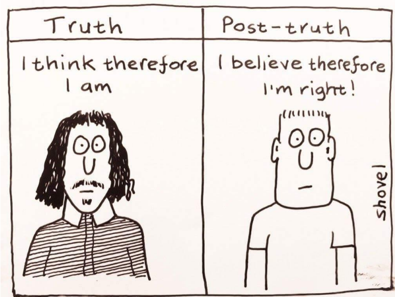
Martin Shovel cartoon "Truth vs Post Truth" @martinshovel 10 Δεκ. 2016